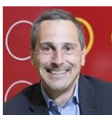
Фредерик Леманн старший вице-президент компании ЛЕГО Групп