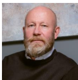
Патрик Антони генеральный директор Ingka Group (IKEA) в России